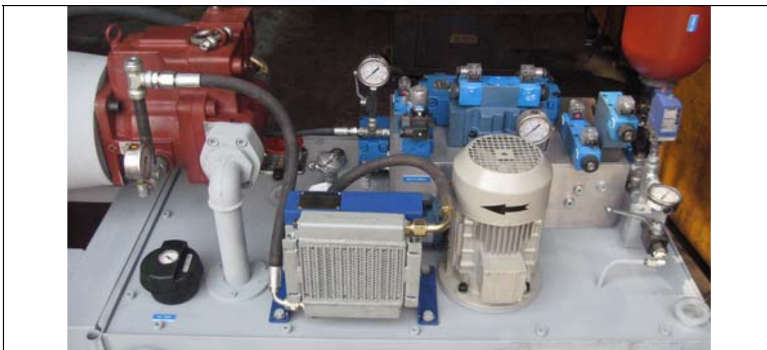
لوله مکش پمپ واریابل ( 2" ) - خط Drain پوسته پمپ 1/2 اینچ