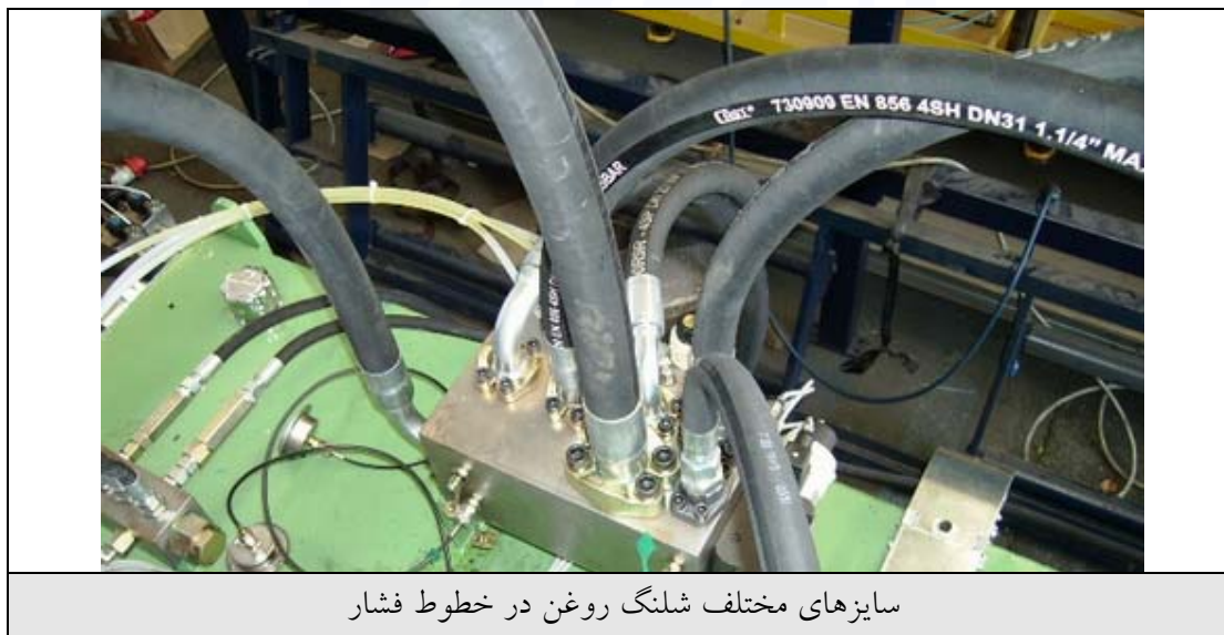
سایزهای مختلف شلنگ روغن در خطوط فشار

یکی از مواردی که به صورت رایج در بین کاربران هیدرولیک بیان میشود این است که مثلاً فلان سایز لوله امکان عبور 50lit/min روغن را دارد. در این مورد باید توجه داشت که ابتدا لازم است مشخص شود لوله مورد نظر در کدام یک از خطوط فشار، برگشت یا مکش نصب شده است. برای مثال لوله با سایز 11.8mm امکان عبوردهی 50lit/min روغن را به عنوان خط فشار دارد. در حالی که همین سایز لوله برای دبی 20lit/min در خط برگشت مناسب است و در خط مکش فقط دبی 8lit/min را میتوان از آن عبور داد (با فرض روغن VG68).