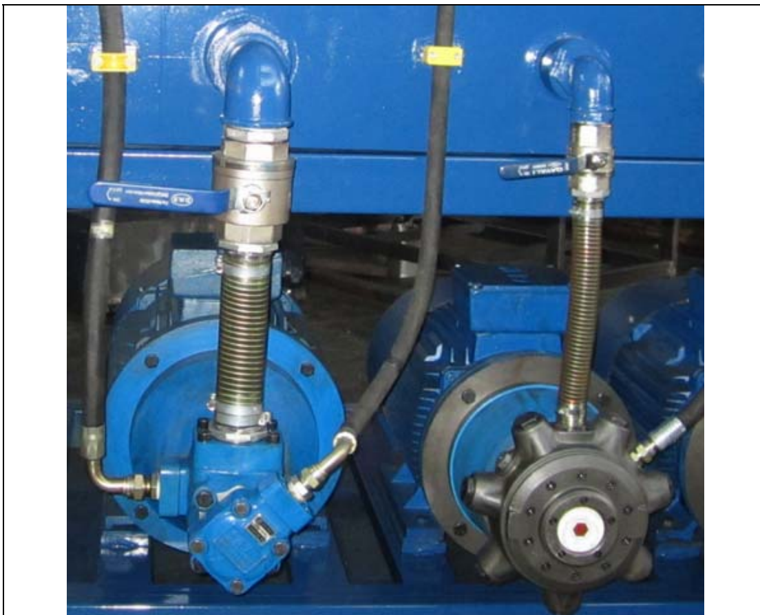
شلنگ فنری سایز ( 3" ) در خط مکش پمپ تیغه ای دابل و شلنگهای 3/4 و 1 اینچ در خط فشار