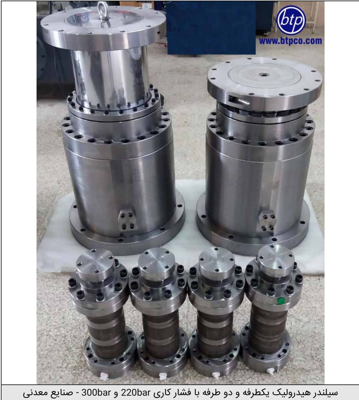
سیلندر هیدرولیک یکطرفه و دو طرفه با فشار کاری 220bar و 300bar - صنایع معدنی