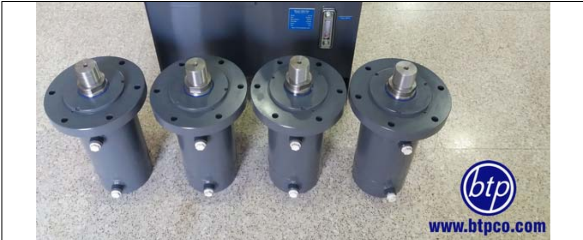
سیلنדרهای جوشی با فشار کاری 200bar - دستگاه تست