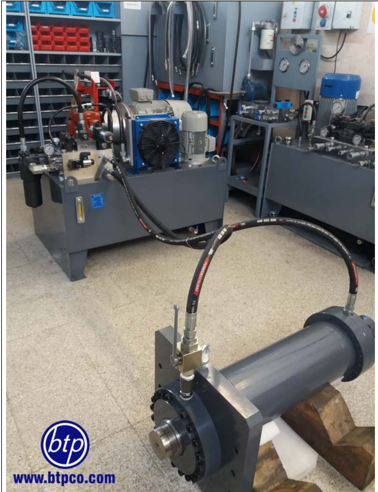
سیلندر هیدرولیک همراه با خط کش اینترنال با فشار کاری 200bar - صنایع هوایی