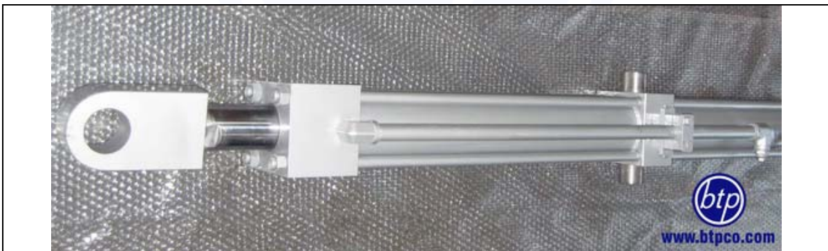
سیلنדרهای چهار میل مهار با پکینگهای دما بالا و فشار کاری 160bar - صنعت فولاد