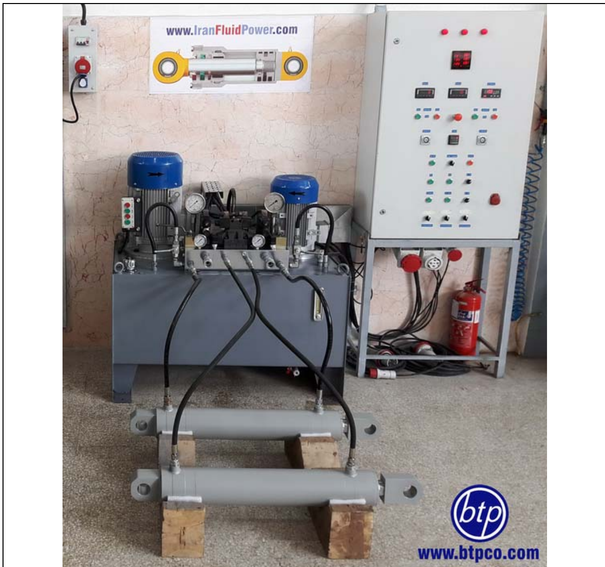
سیلنדרهای جوشی با اتصال دو سر لولا با فشار کاری 200bar - صنعت خودرو