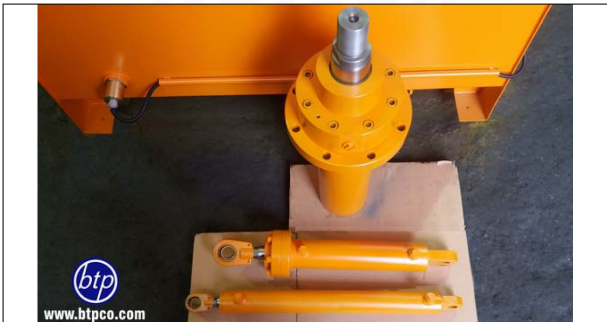
سیلندرهای جوشی با اتصال لولایی با فشار کاری 200bar - دستگاه تست