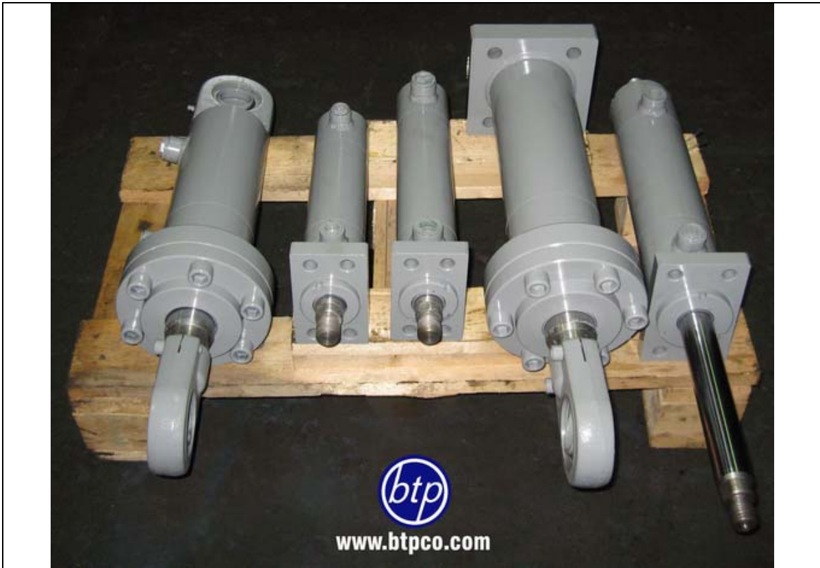
سیلنדרهای جوشی با فشار کاری 200bar - صنعت پلاستیک