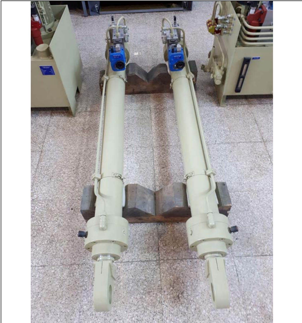
سیلندر خاص شامل بلوک نصب شیرآلات با فشار کاری 200bar - موبایل هیدرولیک