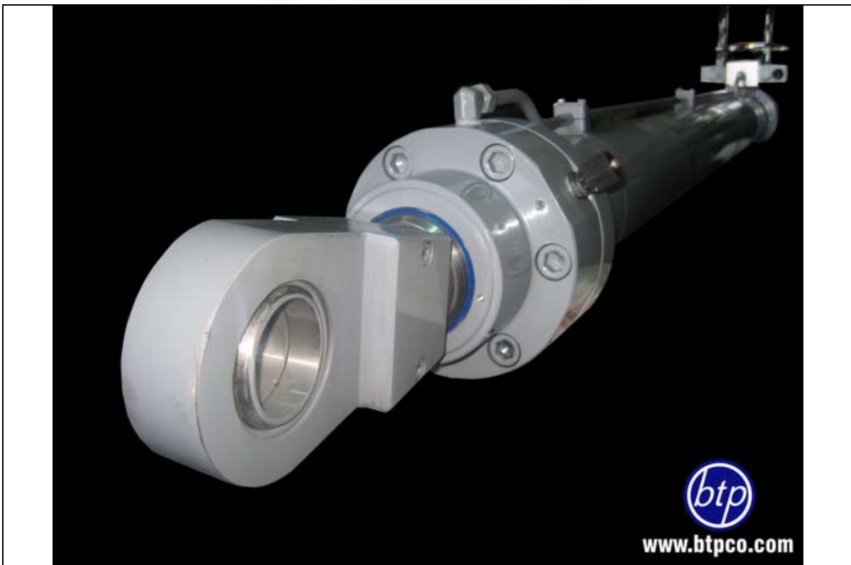
سیلندر دو سر لولا با فشار کاری 220bar - صنعت سیمان