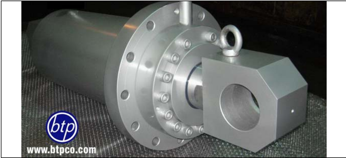
سیلندر جوشی با فشار کاری 300bar - دستگاه تست