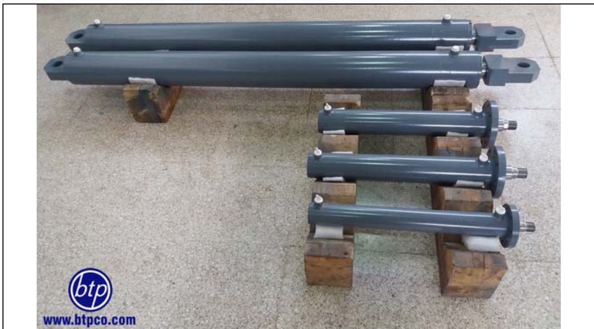
سیلندر جوشی با اتصال لولای سر با فشار کاری 160bar - صنایع معدنی