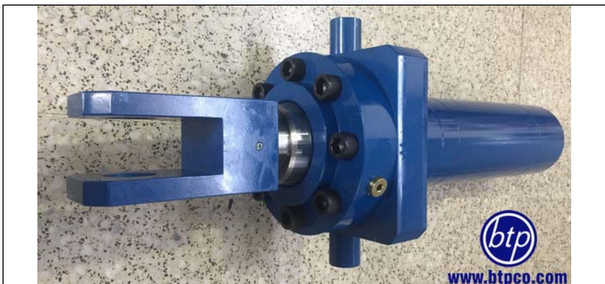
سیلندر جوشی با اتصال لولای سر با فشار کاری 160bar - صنعت آب