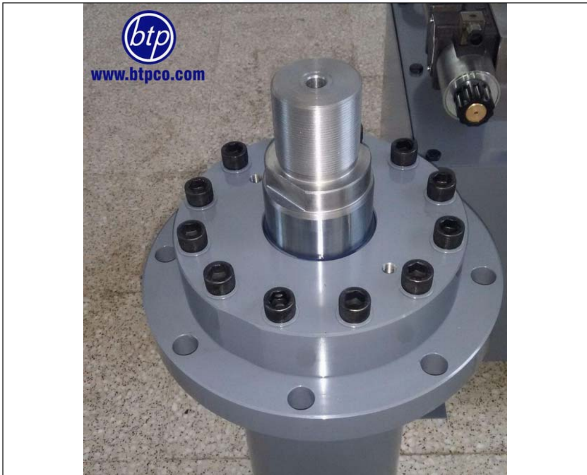
سیلندر جوشی با فشار کاری 200bar - پرس هیدرولیک