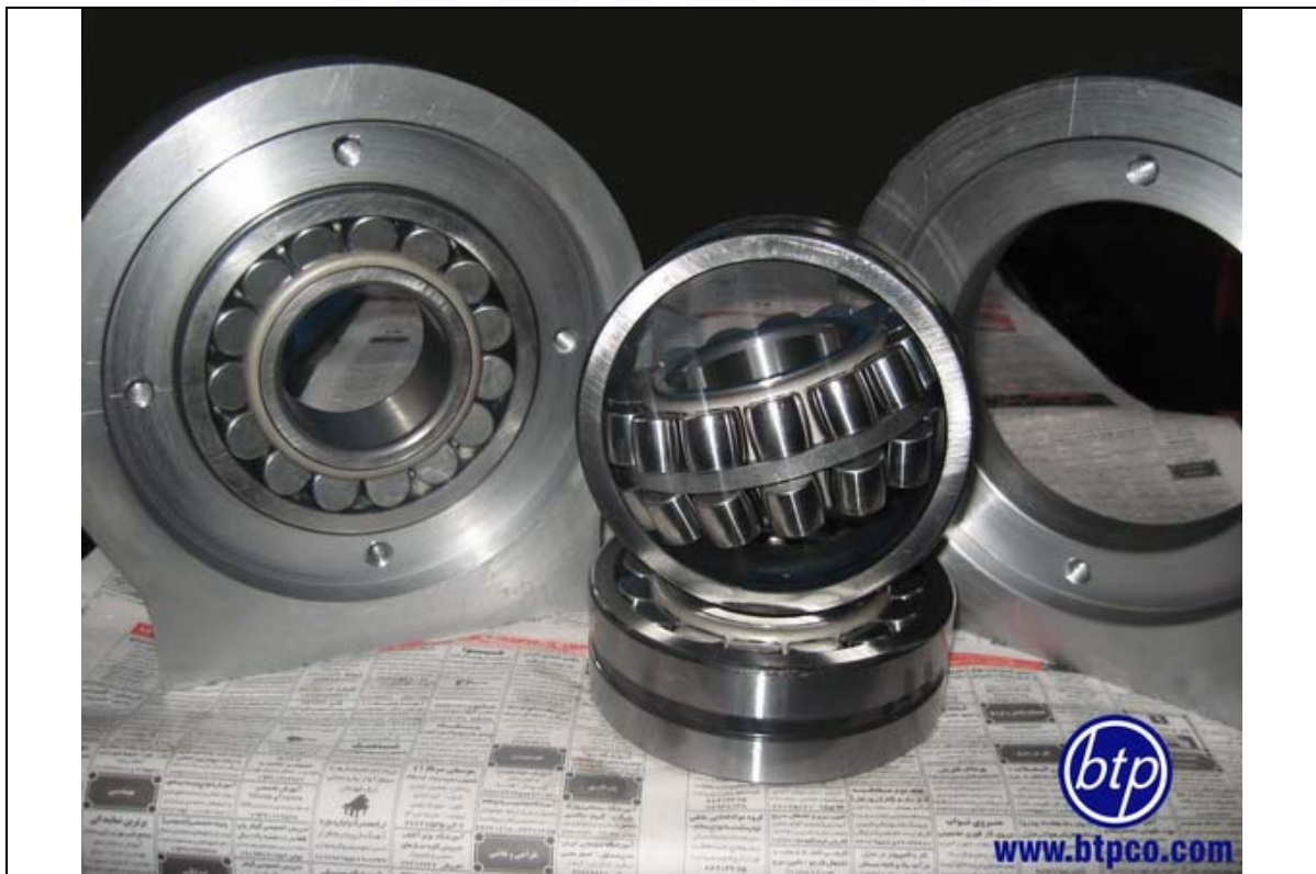
سیلندرهای با اتصال لولایی خاص انتها با فشار کاری 250bar - صنایع معدنی