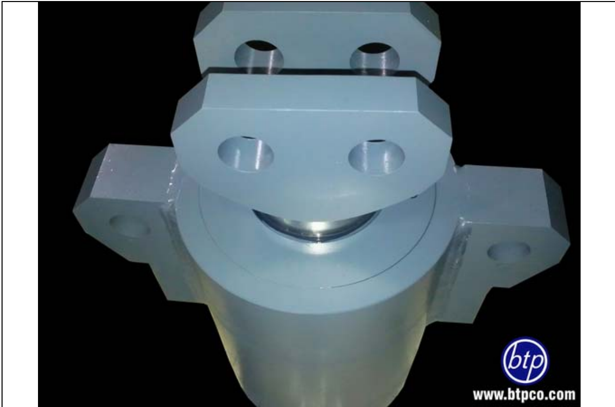
سیلندر خاص با فشار کاری 300bar - دستگاه تست