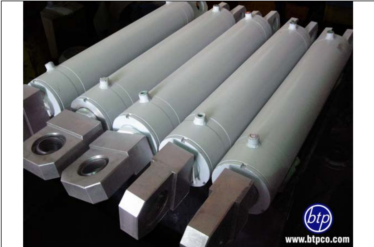
سیلندر جوشی با فشار کاری 160bar - صنایع معدنی