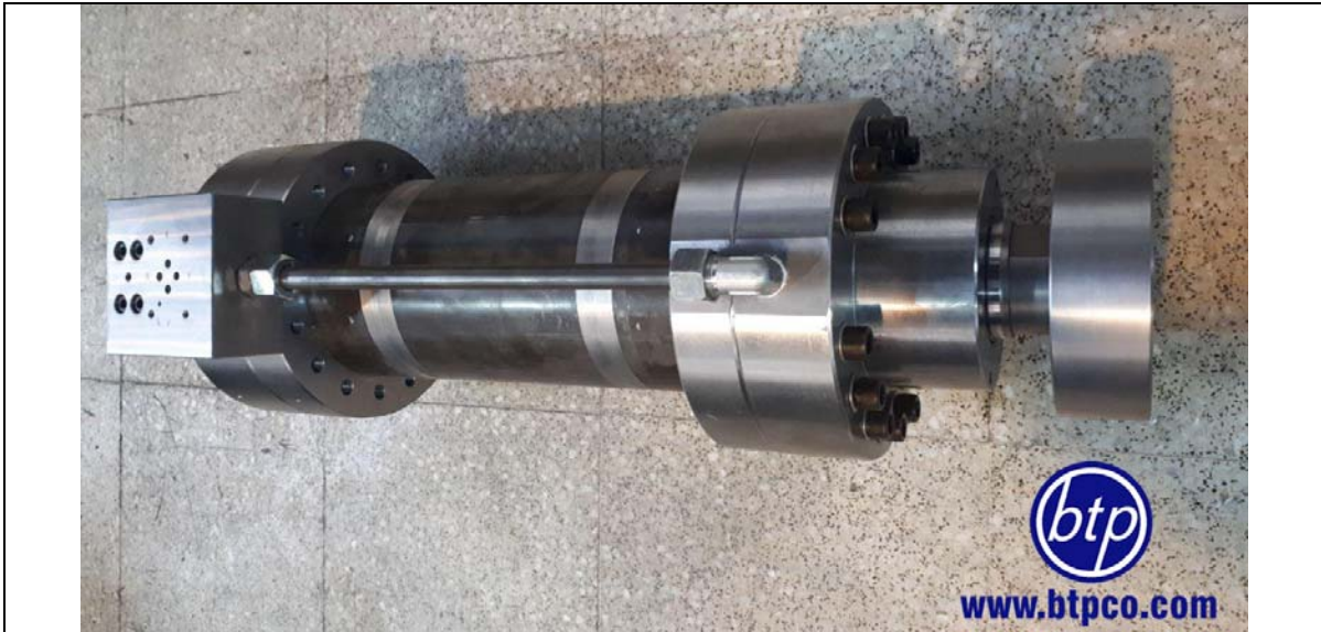
سیلندر خاص شامل بلوک نصب شیرآلات با فشار کاری 250bar - دستگاه تست