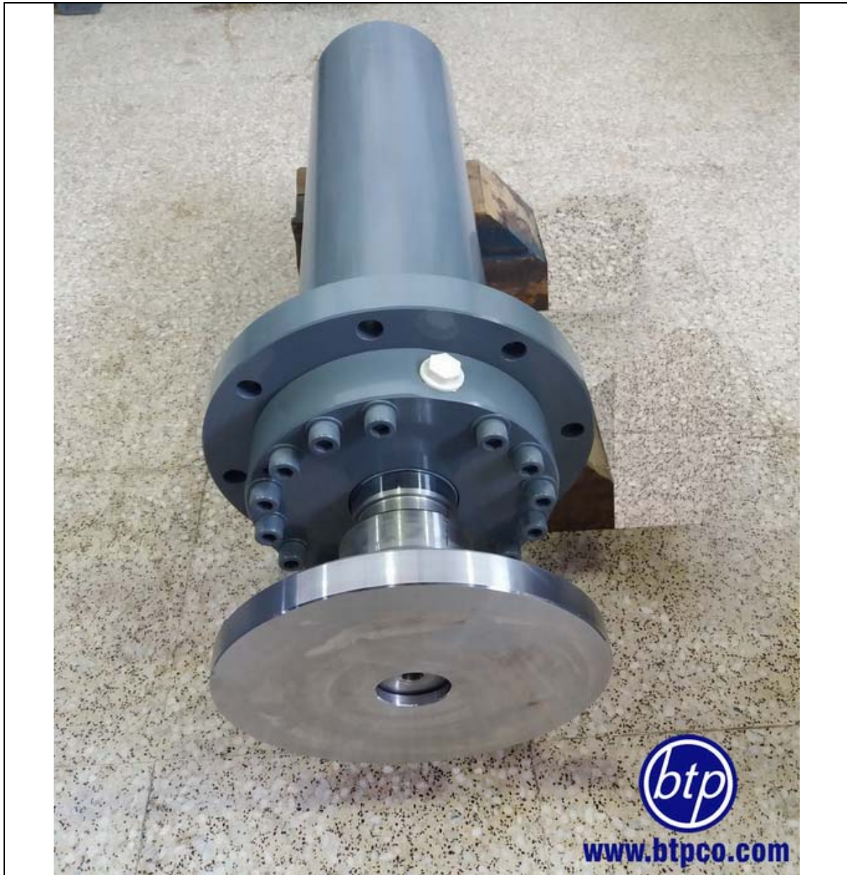
سیلندر جوشی با فلنج مخصوص سر میل و با فشار کاری 200bar پرس هیدرولیک

Total Hydraulic System Solution Provider