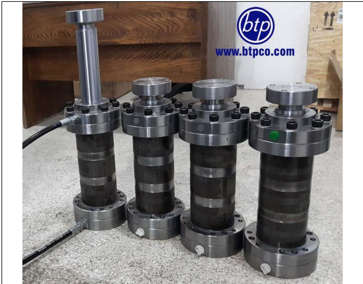
سیلنדרهای فلنجی با فشار کاری 300bar - صنایع معدنی