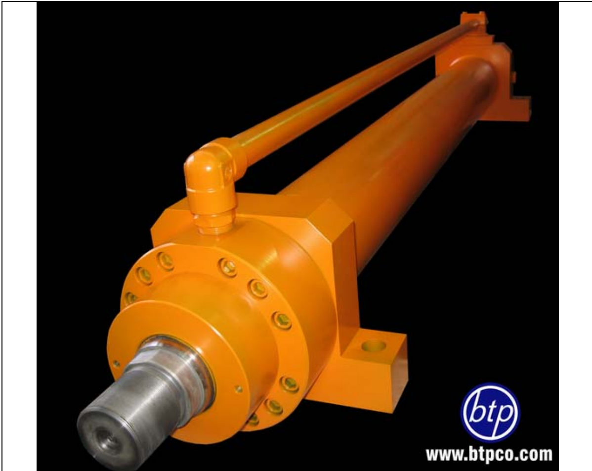
سیلندر پایه دار با فشار کاری 200bar - دستگاه تست